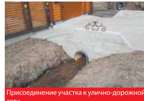
Присоединение участка к улично-дорожной сети

Согласие в письменной форме владельца автомобильной дороги должно содержать технические требования и условия, подлежащие исполнению лицами, осуществляющими строительство, реконструкцию или ремонт примыканий.