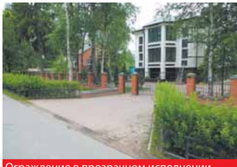
Ограждение в прозрачном исполнении

Каждый из нас хочет, чтобы его дом был большой и красивый, а участок ухоженным, уютным и закрытым от посторонних глаз. Но не все догадываются, что многие параметры в этих вопросах строго регламентированы.